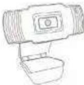
Webcam * 1